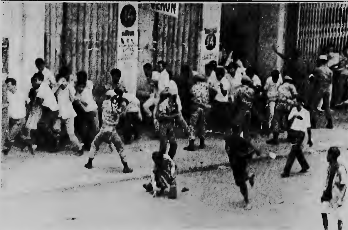
Miembronan di ehercito di Indonesia, aki ta zwaai cu nan rifle contra un grupo di estudiantenan qu tabata protesta contra formacion di e gabinete nobo di Sukarno na Djakarta.

E incidente a tuma luga dura un protesta contra Estados Unidos realiza awe dilanti monumento di independencia den plaza principal dje ciudad. Sin embargo poliznan a sali pa mina e manifestacionnan aquimas o menos 200 persona, m' tras despues nan a retira.